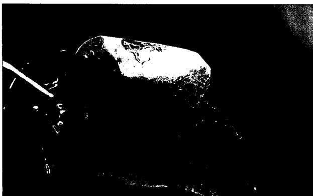
Knochenaufbau mit einem antibiotikahaltigen Kollagen-Lyophilisat

28 Knochenaufbau mit einem antibiotikahaltigen Kollagen-Lyophilisat Dr. Rolf Briant