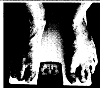
Adipositas in den USA auf dem Vormarsch