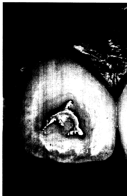
Zahnschmuck, Bericht Seite 6