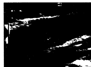
Hochgradige Stenose im Abgang der A. carotis interna