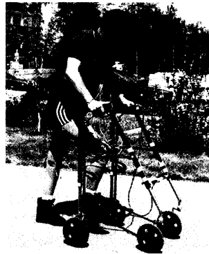
Mensch und Maschine Sensomotorik macht Fortschritte

Antidepressive Behandlung Was tun, wenn der Therapie-Erfolg nicht ausreicht?