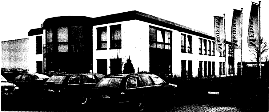
Ein positives Ergebnis verspricht sich die Medisana AG von der Konzentration auf den Fachhandel.