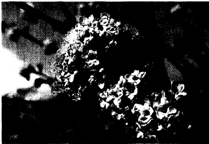
Titelfoto: Schneeball von Margot Spohn