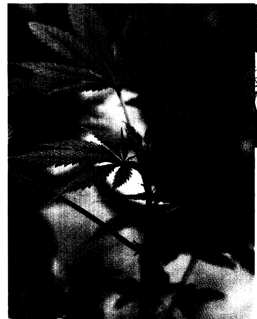
Interferone und Glatirameracetat haben die Therapie bei Multipler Sklerose deutlich verbessert. Begrenzt sind dagegen die Möglichkeiten, Patienten mit Spastik zu helfen. Cannabinoide aus Cannabis sativa können die Beschwerden bei einzelnen Patienten lindern. Seite 32