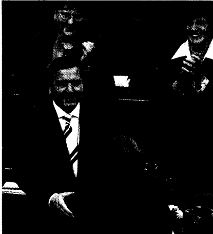
Notgedrungen kommen sich Regierung und Opposition in der Gesundheitspolitik näher. Über den Einsparbetrag gibt es bereits einen Konsens. Der Weg dorthin ist allerdings noch strittig. Seite 8

Gesundheitspolitik: Regierung und Opposition iern aufeinander zu