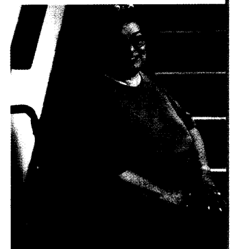
Adipositas ist ein Symptom des metabolischen Syndroms