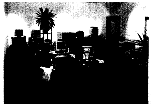
Rund 100 Ultraschallgeräte werden ständig in den Ausstellungsräumen von SMT präsentiert.