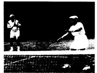
Sport mindert das Risiko einer Schenkelhalsfraktur