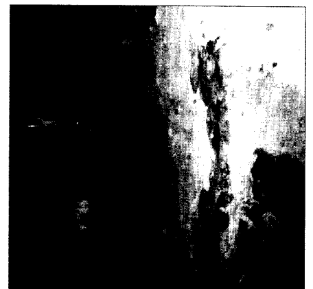
Schimmelpilze: Niedrige Konzentration in der Raumluft schließt Gesundheitsgefahr nicht aus. Seite 20

Titelfoto: Promedico-Archiv Foto: Promedico-Archiv XPiess./Lautmits Amann Vmb