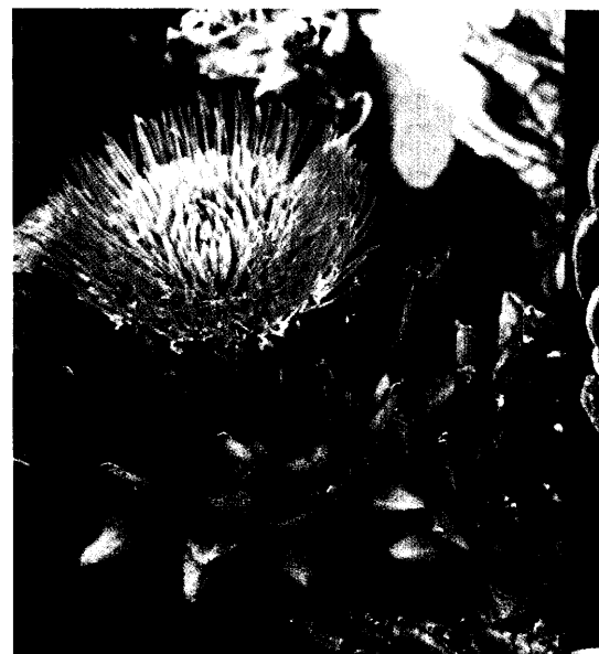
Von Al-harsuf und Strobeldorn bis Cynara scolymus L.: Seit Jahrtausenden schätzen die Menschen Artischocken als aromatische Speise und wertvolles Arzneimittel. Jetzt hat der Studienkreis zur Entwicklungsgeschichte der Arzneipflanzenkunde die Distel-Verwandte zur Arzneipflanze des Jahres gekürt. Seite 47