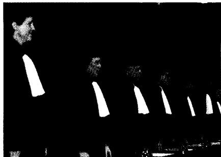
Das Verfassungsgericht hat die Anträge auf einstweilige Anordnung gegen das Beitragssatzsicherungsgesetz abgelehnt. Seite 8

Beitragssatzsicherungsgesetz Verfassungsgericht: Gemeinwohl wiegt schwerer