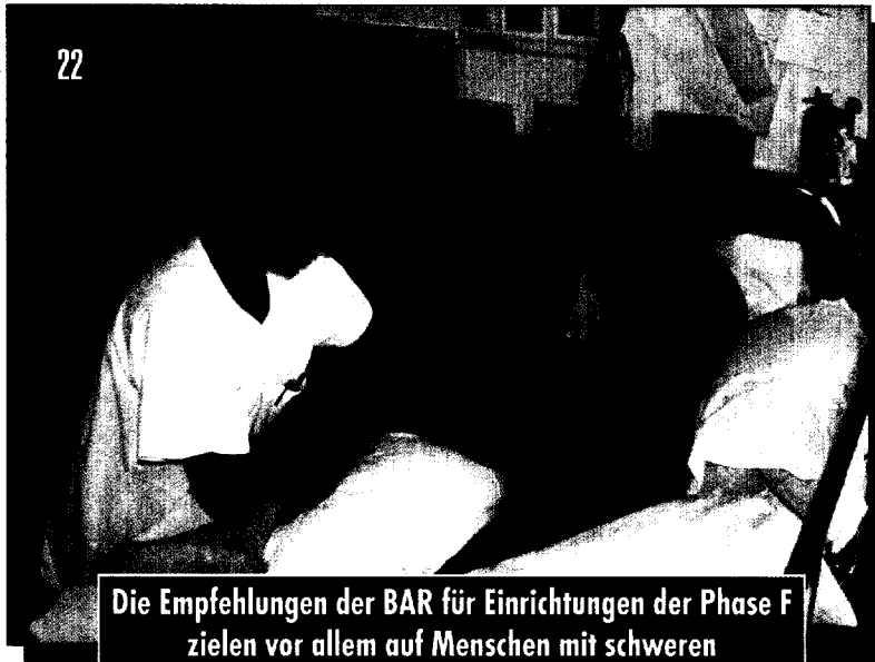
Die Empfehlungen der BAR für Einrichtungen der Phase F zielen vor allem auf Menschen mit schweren und schwersten Schädigungen des Nervensystems.