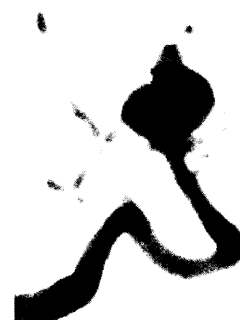
Aneurysma der Basilarisspitze