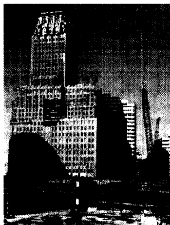
Seite 42 Ein Jahr nach dem 11. September hört die Arbeit des Suchdienstes nicht auf