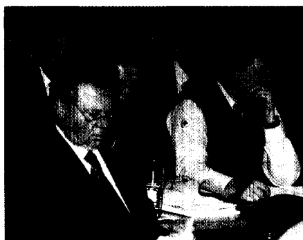
Seite 15 Bei der 52. DRK-Bundesversammlung ging es unter anderem um die neue Finanzordnung