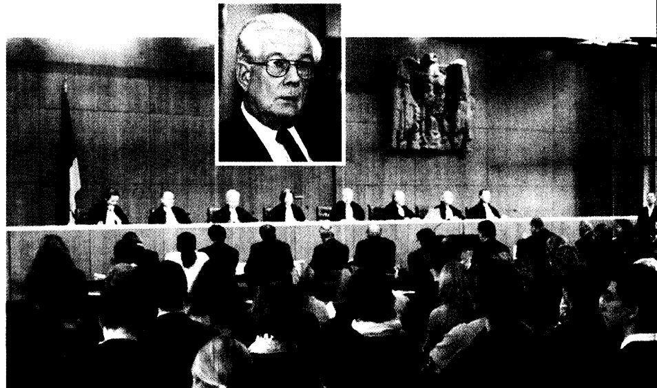
Das Interview mit Prof. Benda, Präsident des Bundesverfassungsgerichts a. D.

Älter werden in ... Magdeburg – der roman(t)ischen Hauptstadt von Sachsen-Anhalt (S. 39). Bürgersinn und Leben für und in der Gemeinschaft haben eine Umgebung geschaffen, in der es sich gut leben lässt.