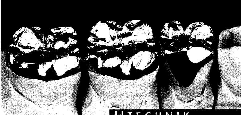
Teilkronen in Gold Seite 434