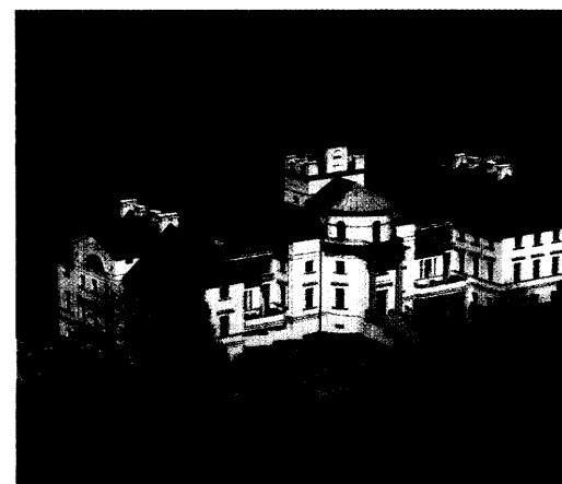
Schlosshotel Burg Schütz Bericht Seite 64