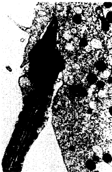
Penetration der Zona pellucida durch ein Spermatozoon.