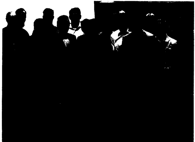
„Junge Implantologen“ tagten in Neckargemünd

64 „Junge Implantologen“ tagten in Neckargemünd Karl-Heinz Glaser