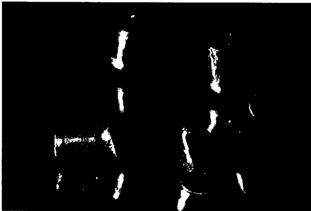
Implantatgetragene, festsitzende Versorgung im zahnlosen Oberkiefer