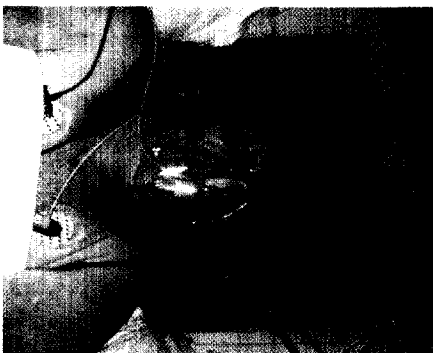
Lagerung des Kopfes eines Patienten mit SHT in Schaumstoffkopfschale.