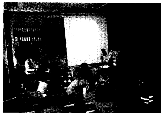
Im Klassenzimmer ist die gesamte didaktische Infrastruktur für den Zahngesundheitsunterricht vorhanden.