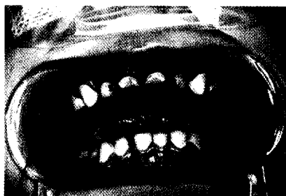
Ein 3-jähriges Mädchen mit EEC Typ II (moderate to severe) Seite 91

Titelbildhinweis: Auch die jungen Damen wissen um die Bedeutung gepflegter Zähne Seite 125