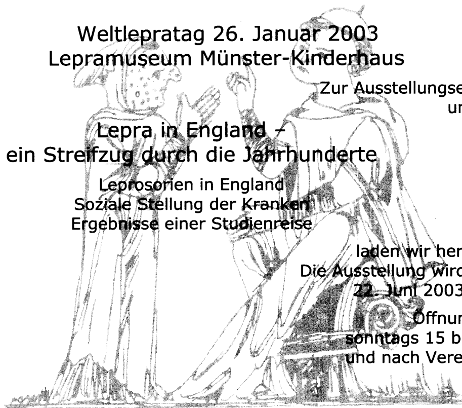
Darstellung eines Leprapatienten aus der Trinity College Library Cambridge

Öffnungszeiten sonntags 15 bis 17 Uhr und nach Vereinbarung