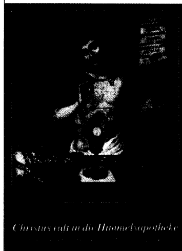
Christus ruf in die Himmelsapotheke

Heil und Heilung liegen eng beieinander auf den Bildern, die Christus im Apothekenambiente zeigen. Noch bis zum 26. Januar präsentiert das Museum Altomünster eine im deutschsprachigen Raum einmalige Ausstellung.