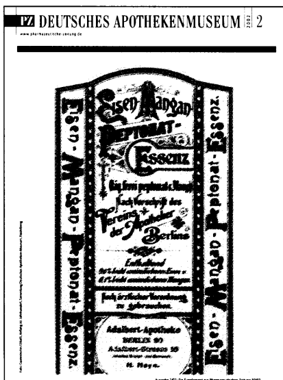
Dieser Ausgabe liegt das Supplement »Deutsches Apothekenmuseum 2/02« bei.