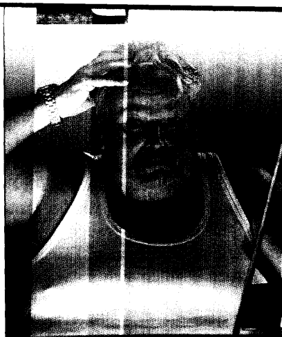
Hypertriglyzeridämie beim Typ 2-Diabetiker.

Mit dem Passwort doc finden Sie in www.medical-tribune.de spezielle Informationen für Ärzte.