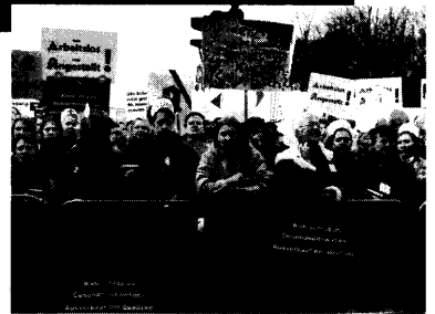
Gegen die Nullrunde im Gesundheitswesen protestierten über 15.000 Gesundheitsberufler in Berlin. ▶ Seiten 6/7