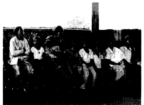
Sprechstunde in Nirgendwo oder der ärztliche Kurzeinsatz in Mindanao. ▶ Seite 28

► Offizielles Organ der Landesärztekammer, der Bezirksärztekammern und der Kassensärztlichen Vereinigungen Rheinland-Pfalz