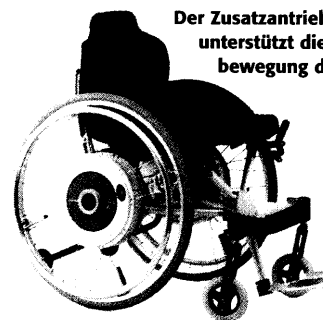
Der Zusatzantrieb e-motion unterstützt die Anschubbewegung des Fahrers