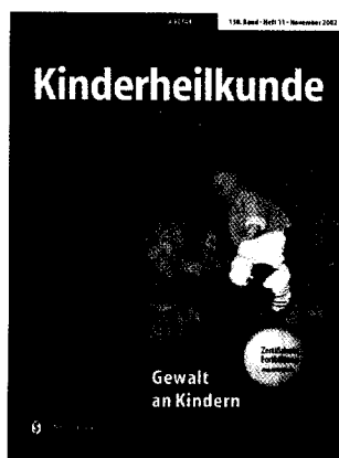
Titelfoto: Gestaltung: deblik Berlin