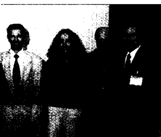
al im Juni 2001 blieb der e.

den zweiten Hörster und Ruth Kölb- drei weitere töße gegen erversamm-