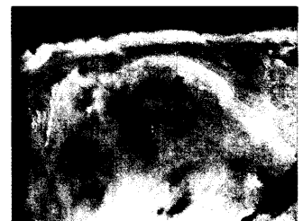
Liposarkom der Haut