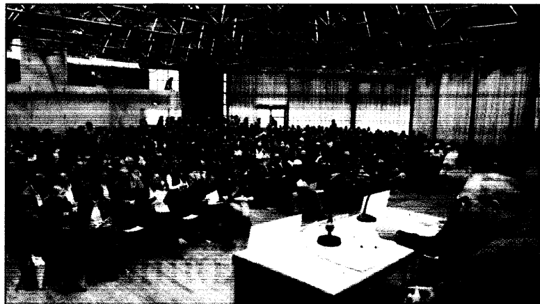
Baden-Württembergs Ärzte zeigen sich konfliktbereit.

enten mit Morbus Basedow soll- im akuten Stadium nicht in die na gehen. Denn ihr Kreislauf, der ch die hyperthyreote Stoffwech- ge schon belastet ist, kann auf e empfindlich reagieren. Wenn ten nach erfolgreicher Therapie er euthyreot sind, ist gegen ei- abesuch nichts einzuwenden. s sollten aber nicht nur die senwerte normal sein, sondern druck und Pulsfrequenz. Extre- peraturen oder längere Aufent- halte von mehr als 15 Minuten ratsam (Brakebusch / Heufel- en mit Morbus Basedow“).