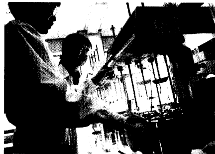
Mit Empörung haben mehrere deutsche Pharmaunternehmen auf die Sparpläne der Bundesregierung reagiert. Seite 54

Vorschaltgesetz: Industriepflicht Entlassungen und Investitionsstopps