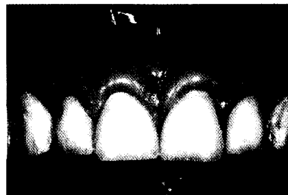
Oben: Stark zerstörte und sehr kurze Schneidezahnkronen. Der Gingivazentrit der Eckzähne liegt weit oberhalb desjenigen der Schneidezähne.