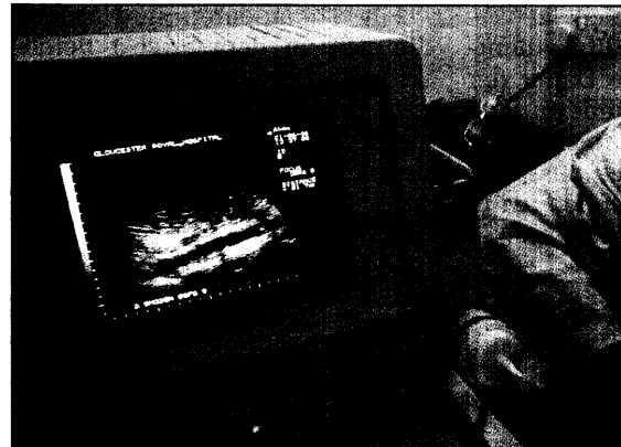
Sonographische Untersuchung der Bauchaorta bei einfachen Geräten läßt sich der Gefäßdurchmesser be

Bei 1333 Männern der Sonographie-Gruppe wurde ein Aneurys-