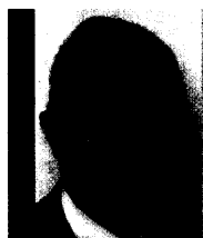
J.-P. Barrère p. 34