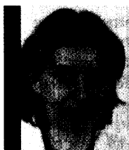
C. Stoltz p. 32