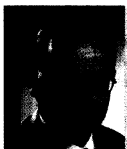
S. Glimm p. 44