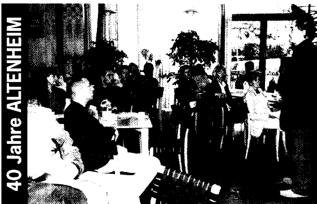
40 Jahre ALTENHEIM