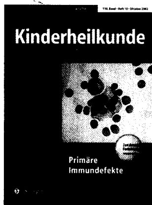
Titelfoto: Gestaltung: deblik Berlin