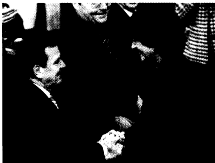
Um die Kassen der Kassen steht es schlecht. Auf Bundesgesundheitsministerin Ulla Schmidt warten große Aufgaben. An eine strukturelle Reform denkt sie dennoch nicht. Seite 8

Gesundheitsreform: Regierung gerät unter Druck