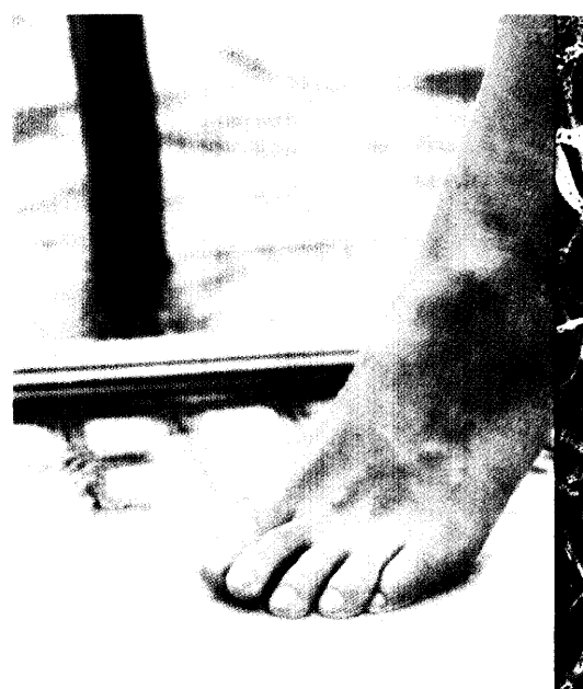
Fußpilz: Die meisten Teilnehmer einer apothekenbasierten Felduntersuchung vermuteten, sich bei Freizeitaktivitäten infiziert zu haben. An der Fragebogenaktion zu Wirksamkeit und Verträglichkeit von Bifonazol-Creme nahmen mehr als 1800 Patienten und 285 Apotheken teil. Seite 16