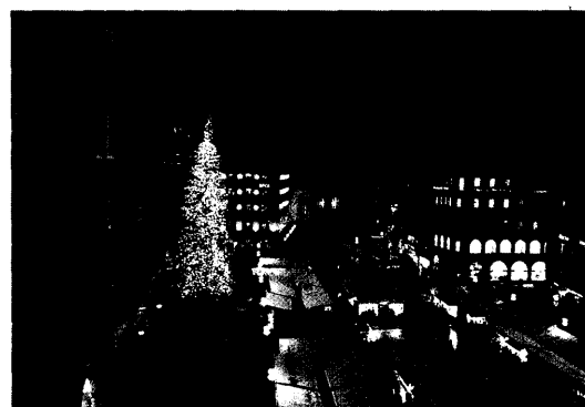
Weihnachtsreise nach München Bericht Seite 46