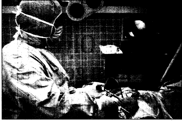
Wer über außergewöhnliche Erfahrungen verfügt, darf darauf in sachlicher Form aufmerksam machen.

Ausgangspunkt für die Entscheidung war ein Streitfall um orthopädische Klinik-Fachärzte. Diese hatten zum einen mehr als zehn Jahre nur Wirbelsäulen-Ops (7000), zum anderen seit 15 Jahren vor allem Knieoperationen