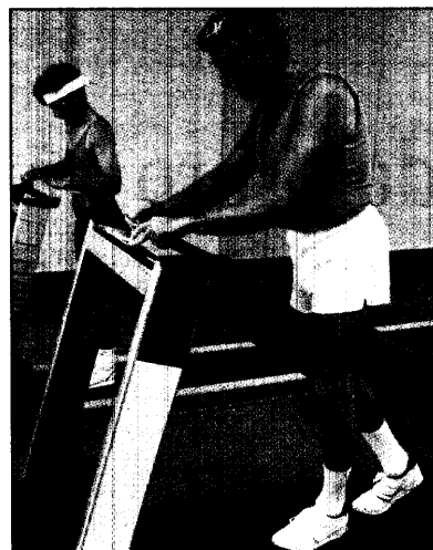
Laufen und Gymnastik halten das Penis-Gewebe jung.

In einer Studie mit 138 Männern mit ED untersuchte der Urologe und Sportmediziner die Wirkung von Muskeltraining auf die Potenz. Ein Drittel der Männer absolvierte vier Monate lang ein Beckenbodentraining, ein Drittel verwendete