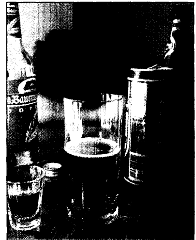
Allein schaffen es Patienten kaum, ihren erhöhten Alkoholkonsum zu senken.