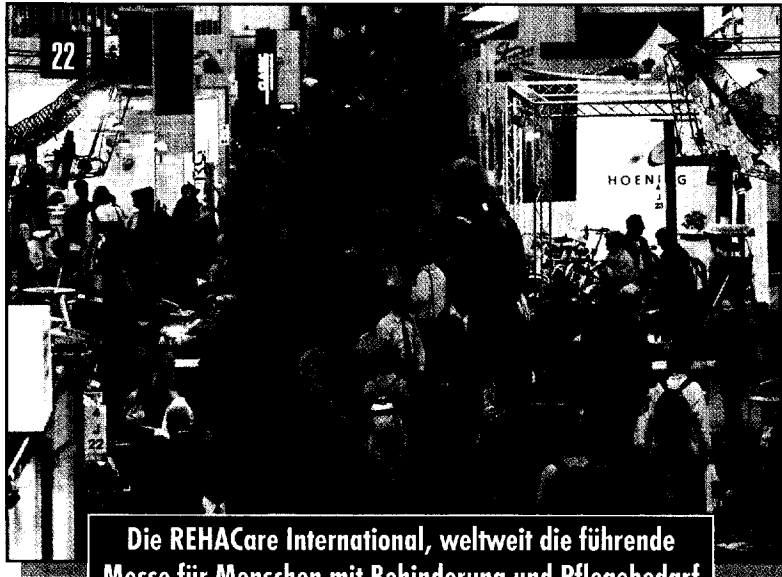
Die REHACare International, weltweit die führende Messe für Menschen mit Behinderung und Pflegebedarf öffnet in diesem Jahr zum 25. Mal ihre Pforten.