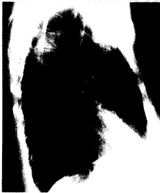
Abb.: J. T. Siveke

Auch die Hypotonie ist einer genauen Diagnose wert. Welche Tests aussagekräftig sind und was therapeutisch getan werden kann, steht im Schwerpunkt.