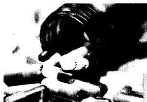
Eine Auswahl neuer effektiver medikamentöser und minimal invasiver Therapiemöglichkeiten werden im Schwerpunktteil dargestellt.