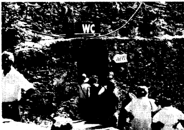
No chance bei Blasenproblemen: Warteschlangen vor dem WC auf Massenveranstaltungen....