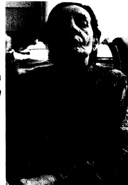
Psychosen beim M. Parkinson Medikation fein austarieren